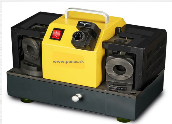
Vrtáky HSS DIN 338