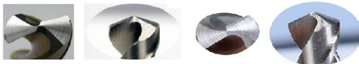
Vrtáky TK aj HSS DIN 6537